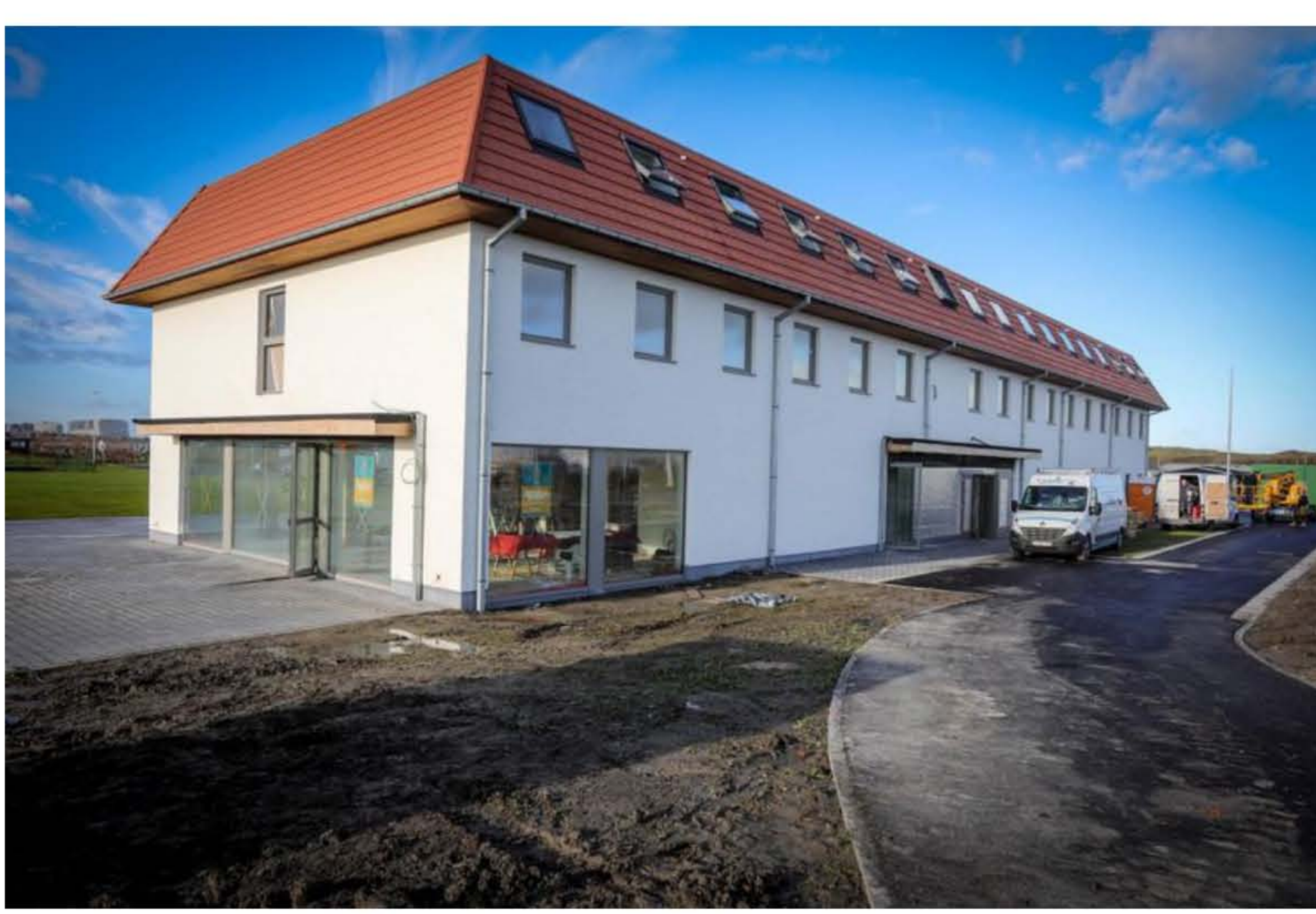
Het hotel Ibis Budget Airport opent in juni 2018.

Heel wat bedrijvigheid in het Ibis Airport-hotel, op de grens van Oostende en Middelkerke. Twintig arbeiders van DuboisCtrl uit Lauwe, gespecialiseerd in onder meer sanitair en verwarming, werkten keihard in 33 van de in totaal 102 kamers. Aan elke deuropening hing een checklist, die de medewerkers fijntjes herinnerde aan hun taken, maar vooral aan het waarom van hun doorgedreven actie.